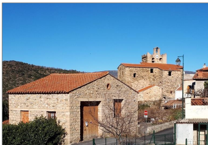
L'église de Sirach